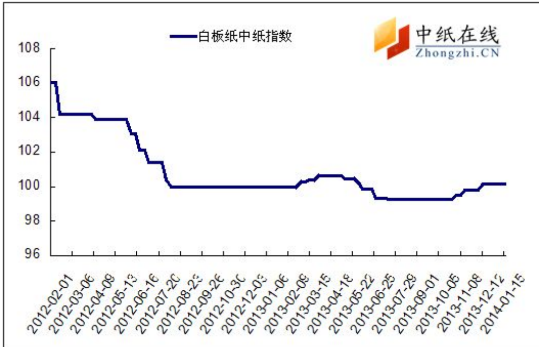
图 1：白板纸中纸指数走势图

2014年1月17日白板纸价格指数为100.16，与上周持平，较周期内最高点106.02（2012-2-1）下降了5.86。