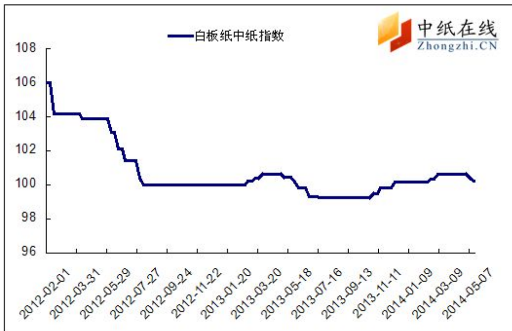
图 1: 白板纸中纸指数走势图

2014年5月23日白板纸价格指数为100.26,与上周持平,较周期内最高点106.02(2012-2-1)下降了5.76%。