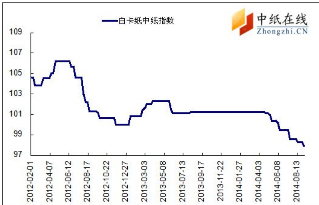
图 1：白卡纸中纸指数走势图

2014年9月5日白卡纸价格指数为97.95，与上周比下降0.32，较周期内最高点106.20点（2012-5-2）下降了8.25%。