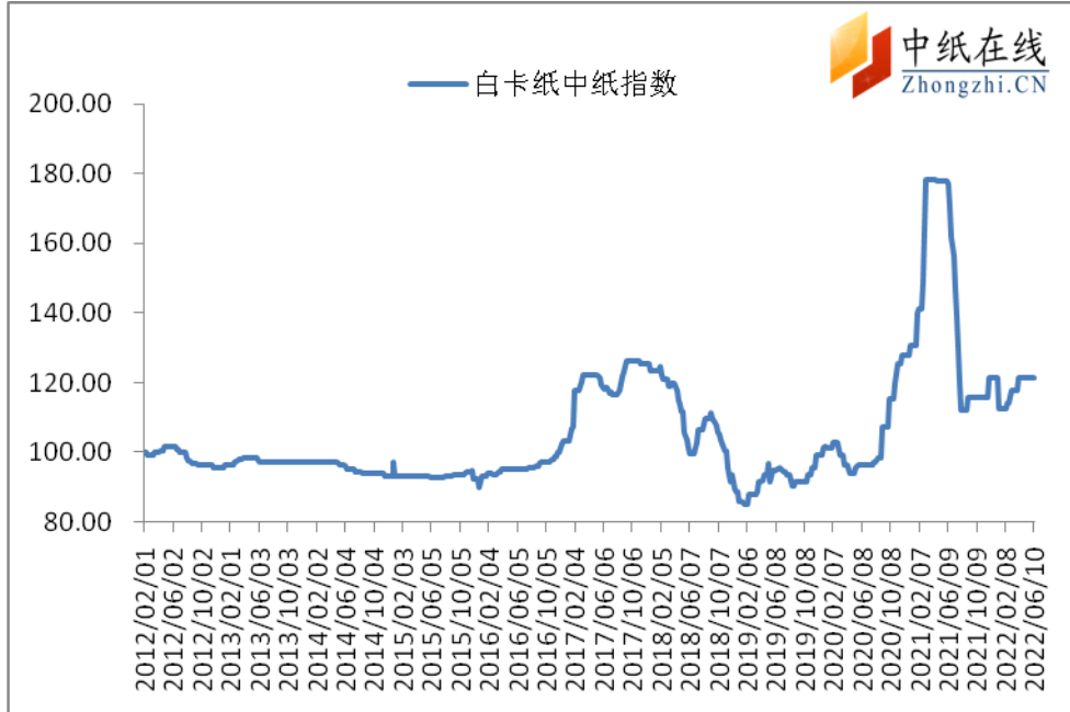
图 1：白卡纸中纸指数走势图