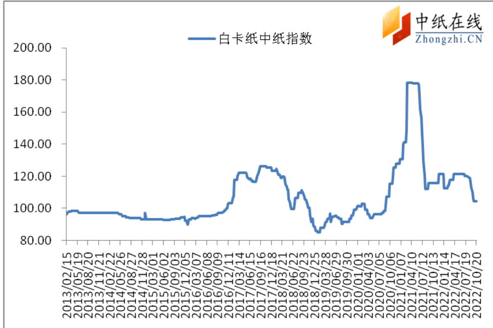
图 1：白卡纸中纸指数走势图