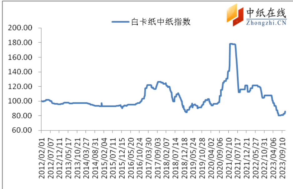
图 1：白卡纸中纸指数走势图