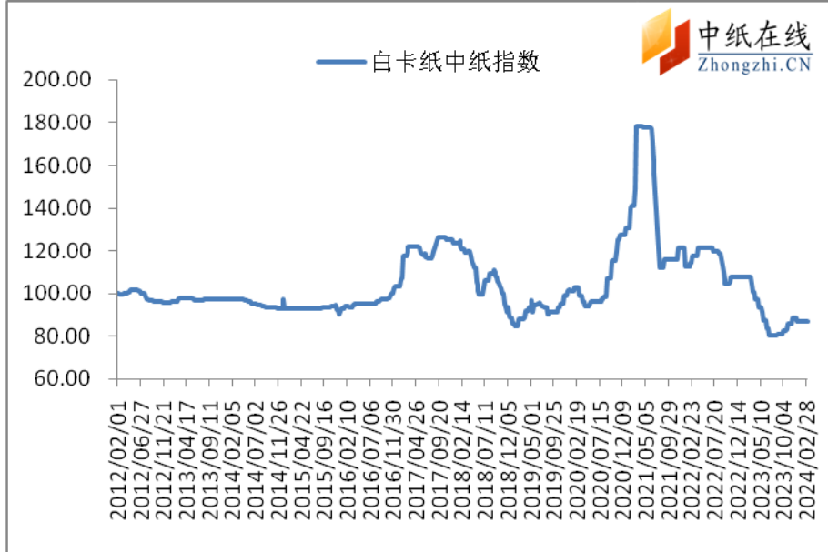
图 1：白卡纸中纸指数走势图