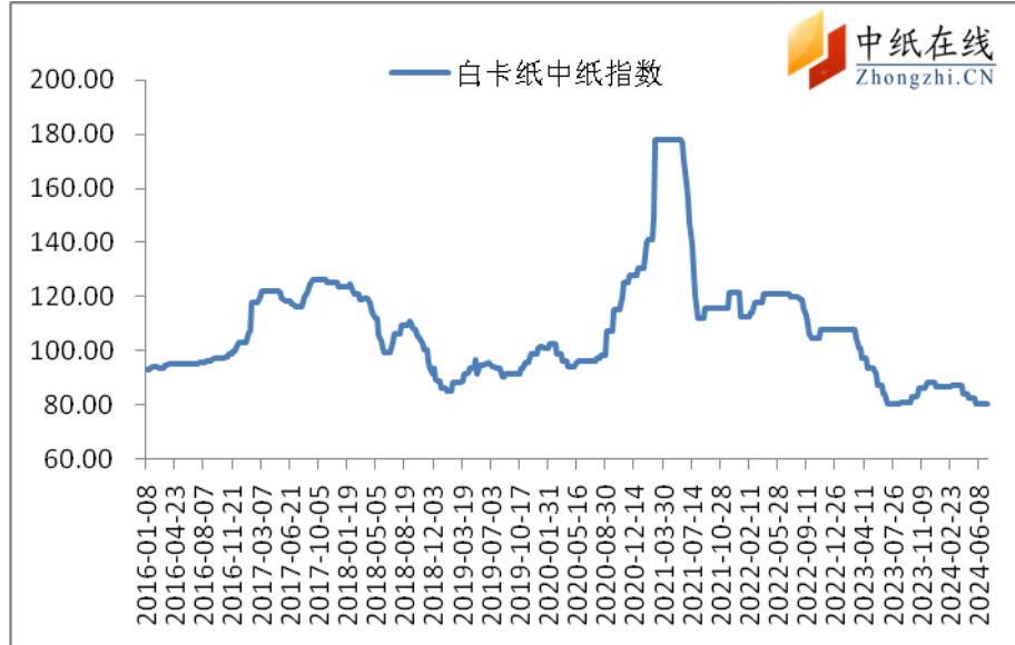
图 1：白卡纸中纸指数走势图