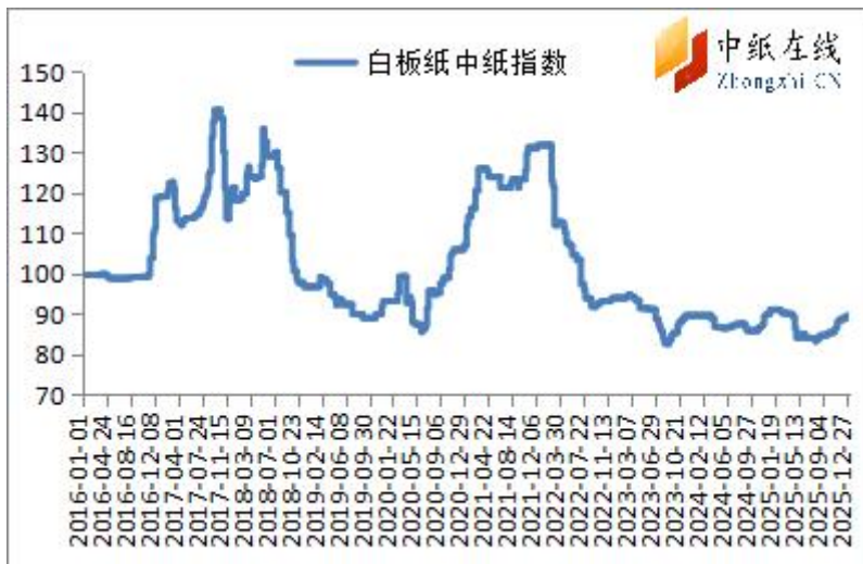
图 3：白板纸中纸指数走势图